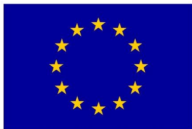
Euroopa Liit Euroopa Sotsiaalfond